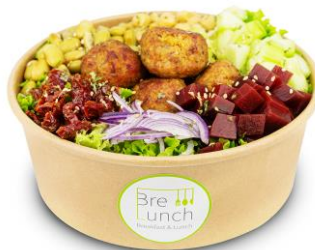
SALATE / BOWLS