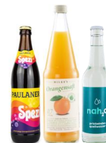
LIMOS / SÄFTE / WASSER