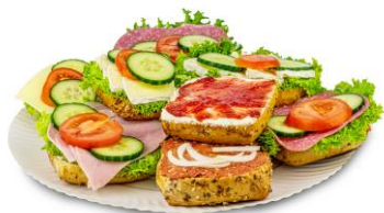
KLEIN / MITTEL / GROß